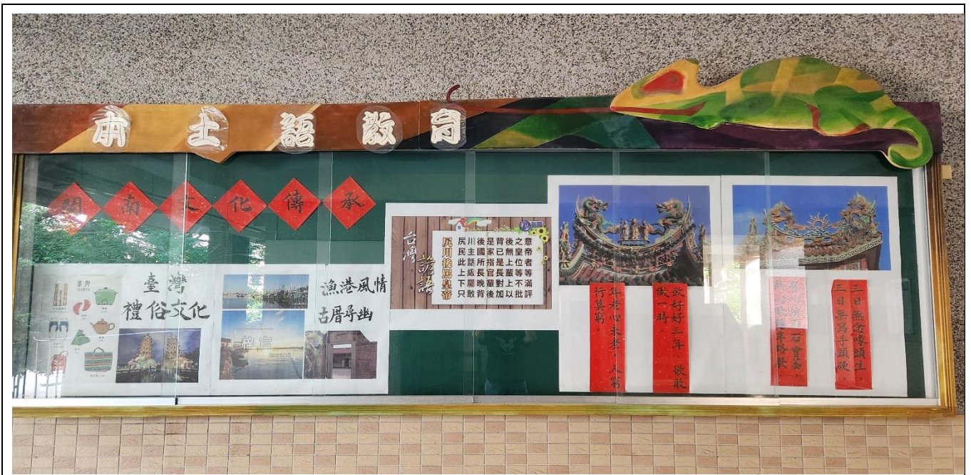
112 學年中走廊本土語教育公布欄