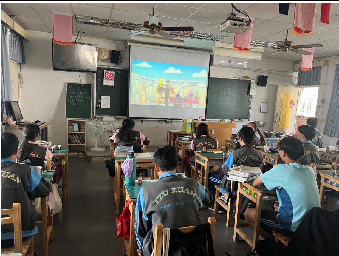
113.2.21 午餐時間配合世界母語日進行本土與相關影片宣導