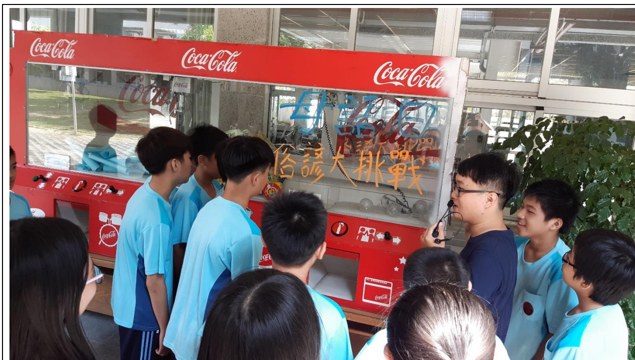
照片說明：結合學務處娃娃機進行母語日俗諺挑戰活動