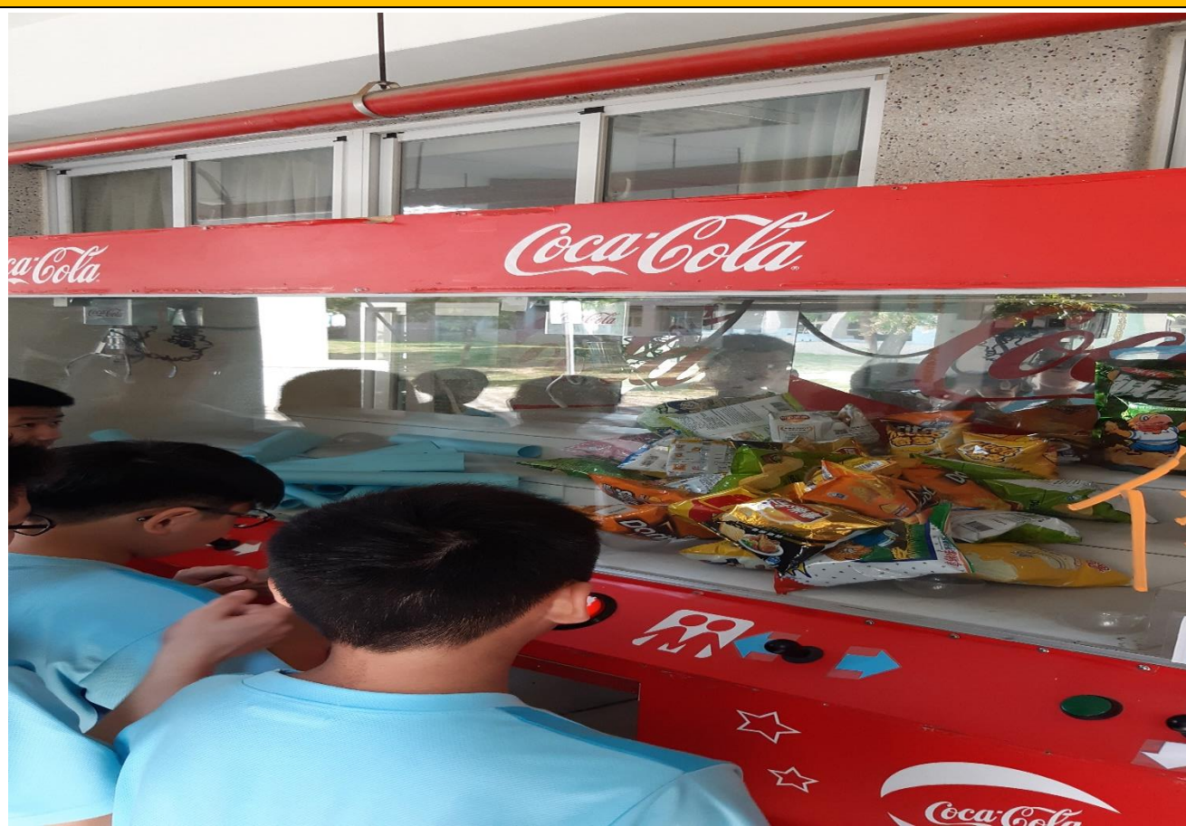
照片說明：結合學務處娃娃機進行母語日俗諺挑戰活動